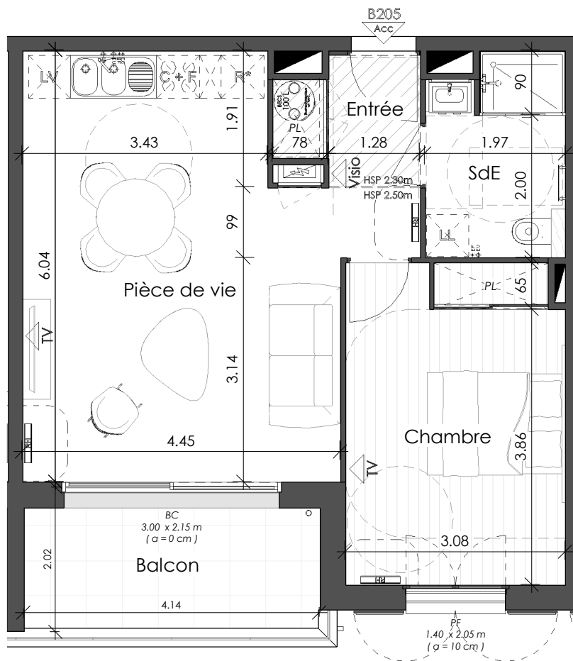
Plan du Logement (1 : 75)