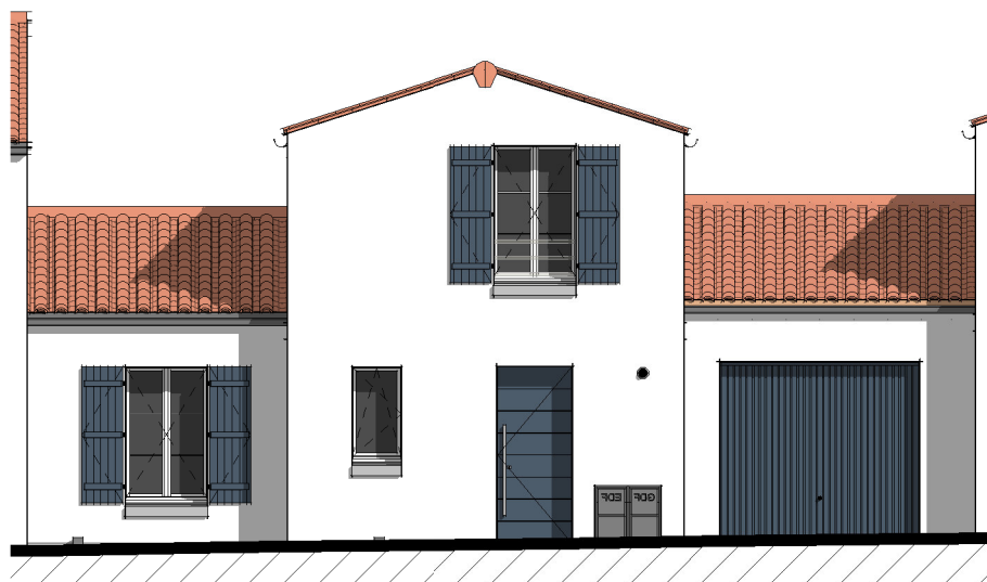
Façade Avant ( 1 : 100 )