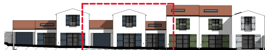
Façade Arrière ( 1 : 350 )