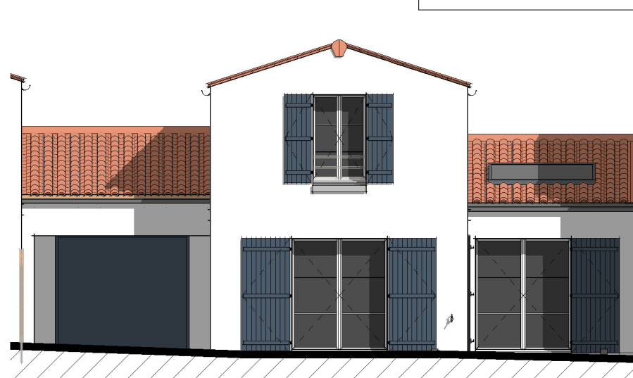
Façade Arrière ( 1 : 100 )