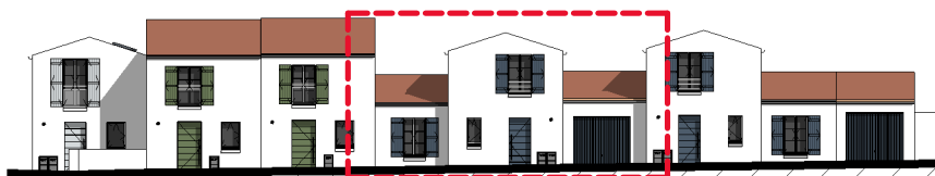
Façade Avant ( 1 : 350 )