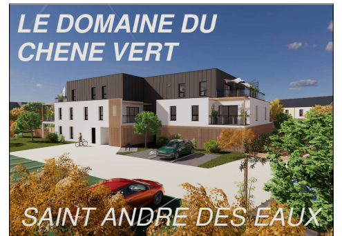
Plan Masse Collectif B